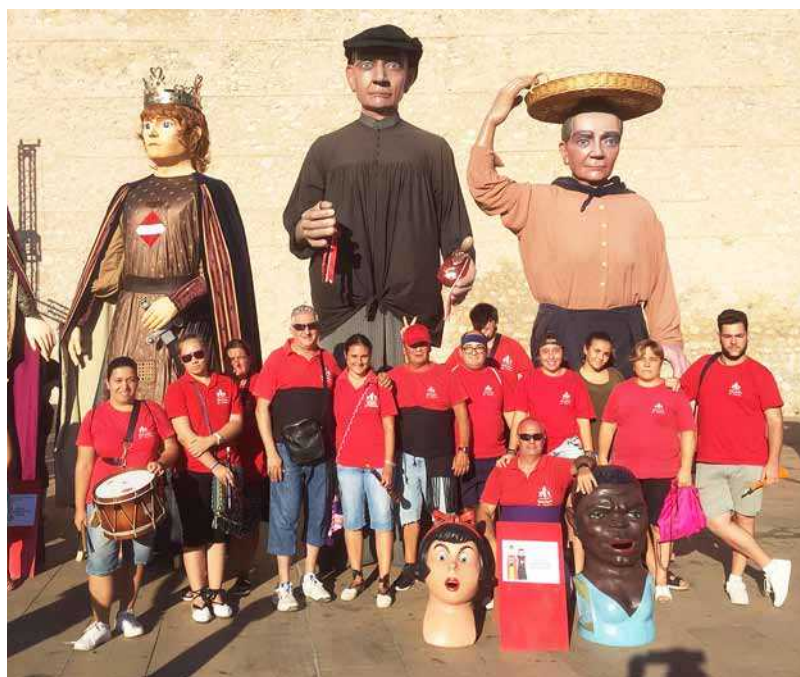
Seguint amb el cap de setmana, el diumenge 13 d'agost, la colla de Nanos i Gegants de Vinaròs va seguir de viatge, desplaçant-se fins a l'Hospitalet de l'Infant celebrant la XXXª trobada de gegants dels nostres companys.