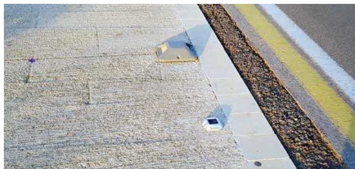
Las balizas fueron robadas tras ser recientemente instaladas