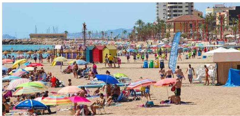
La playa del Fortí, llena este verano.

Redón y Ursola, a favor de Jaume Juny, habitantes de dicha localidad, ante el notario Miquel Pere. Su interés radica no solo en su antigüedad, sino en su contenido en el cual se citan nombres propios, partidas de la población, se cita la existencia de un molino textil, además de su interés documental en el cual se especifica un préstamo censal sobre dicha masía de 55 libras a dicho matrimonio a cambio de un interés anual de 91 sueldos y 8 dineros.