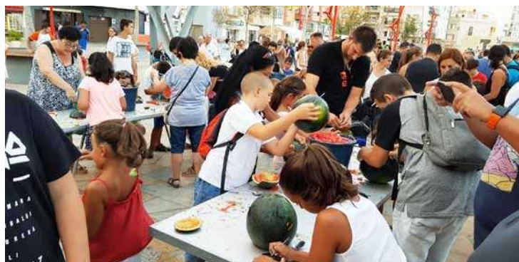
Taller de fanalets fets amb meló de moro, organitzat per l'associació cultural Ball de Dimonis i amb cercavila acompanyats per la Colla de Dolçaina i Tabal. E.Fonollosa