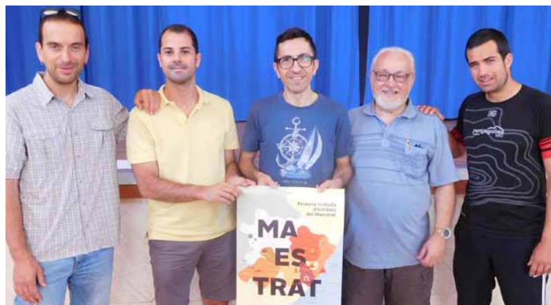
La Coordinadora d'Entitats del Maestrat es regirà pel Consell de Coordinació, un òrgan de representació constituït per totes les associacions adherides

El Consell de Coordinació també estarà format per les setze entitats constituents restants, que assumiran,