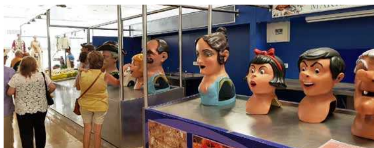
Els nanos i gegants s'exposen al mercat E.Fonollosa

Vinaròs, mentre que també estava "La Víbria" de Reus. Es va explicar també amb la presència de "Hydracus" de Jesús (Tortosa) i completaven "Vibrietes i Dragolins" de Castelló.