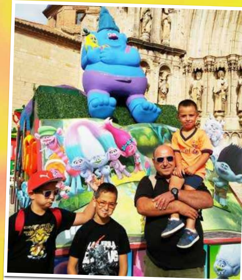
Presència vinarossenca a l'Anunci de Morella. E.Fonollosa