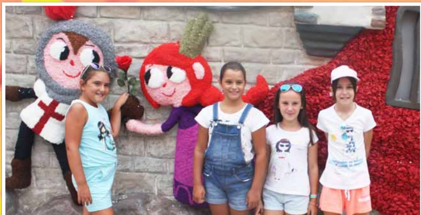
La reina y dames infantils de Vinaròs a la festa de l'anunci de Morella