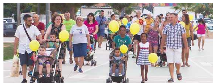
Caminada amb carrets de bebé