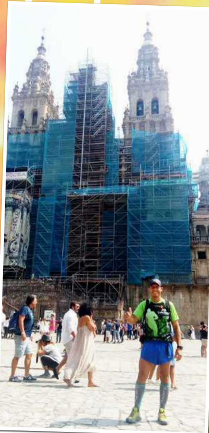
Objectiu conseguit per Raül: Oporto-Santiago. 250 km. 5 ultres per etapes. 6 maratons. 4 dies. ¡Vamos!