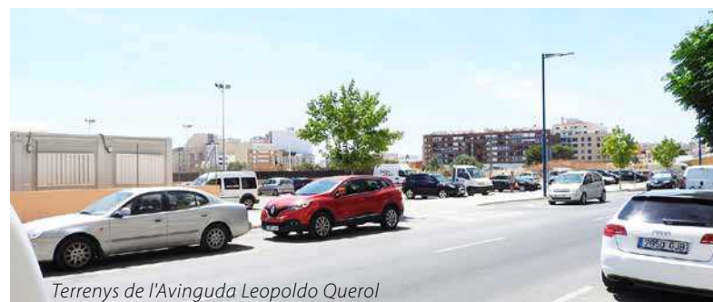
Terrenys de l'Avinguda Leopoldo Querol

La arquitecta también valora que la piscina en dicho emplazamiento, "a la vista del envejecimiento progresivo de la población favorecería un gran segmento poblacional sin necesidad