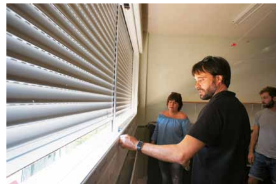
El col·legi rebrà millores en aïllament tèrmic i acústic