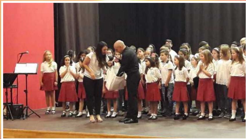
A l'Auditori de Sant Mateu se celebrà este divendres primer de juny el primer intercanvi de corals Sant Mateu-Vinaròs, amb la participació de la coral amfitriona, el cor del CEIP Mare de Déu dels Àngels i l'Associació Cultural Coral Infantil Assumpció de Vinaròs.