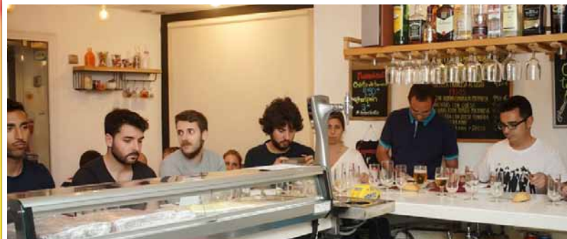
Éxito del III Maridaje en el Bar Antena