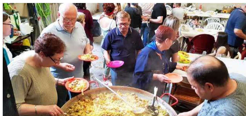
Paella a La Colla. E.Fonollosa