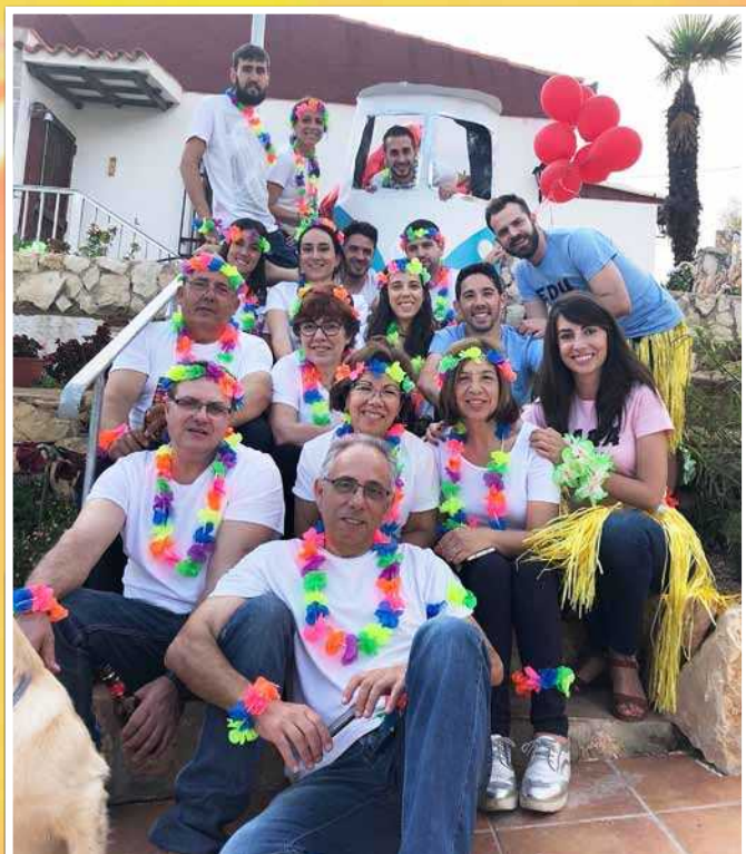
Quina millor manera de retrobar-se que per celebrar el 30 aniversari dels fills grans. Moltes gràcies a les mares, pares, germans i parelles per la festa i sorpresa. Since 1988!