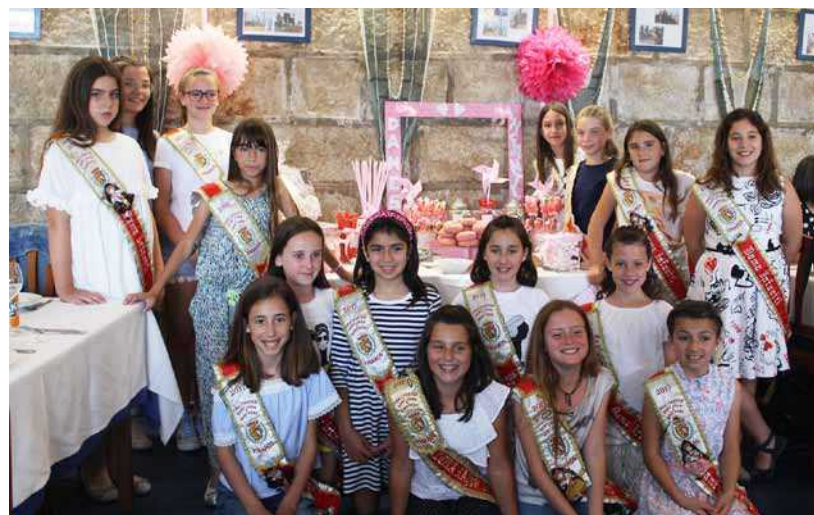
Dinar de despedida de les Dames Infants 2017

Va ser un acte molt emotiu en el que els nostres alumnes van disfrutar actuant a l'escenari i oferint el seu art a les famílies que amb generositat van col·laborar en aquest acte solidari. Gràcies a tots els que ho van fer possible!!