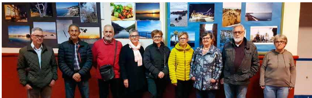
Exposició de fotos fetes amb mòbil al local de FPA