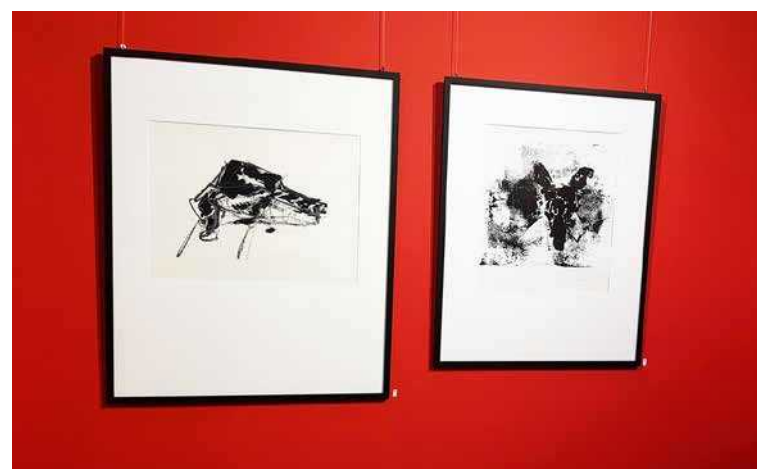
Exposició "Dos dones-dos artistes", de Sibylle Werkmeister i Katrin Schwindenhammer