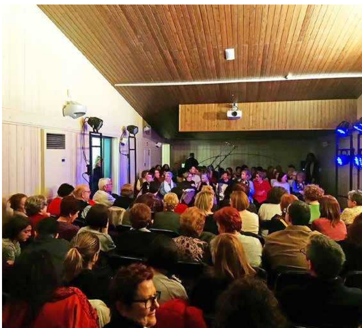
Segona representació del recull de monòlegs del grup "Les Mil i Una de l'Aula Municipal de Teatre de Vinaròs". Una altra vegada, l'Auditori Carles Santos amb l'aforament al complet.