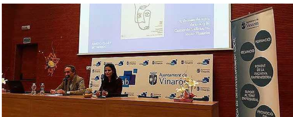
Divendres passat es va celebrar en Vinalab la Jornada "Emprenem en femení"