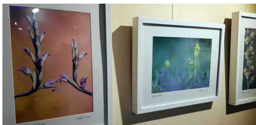
Exposició de l'Ateneu de Natura a la Casa Membrillera de la Fundació Caixa Vinaròs, fins al 13 d'abril, amb fotos de Lluís Ibáñez de les 50 varietats diferents que hi ha d'orquídees a les Terres del Sènia. E.Fonllosa