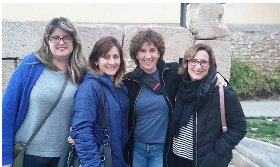
¡Sí! ¡Lo hemos logrado!! ¡ Hoy día 19 de marzo, vamos a por un café para celebrar nuestro día de los Trabajadores Sociales! Compartimos experiencias, vivencia, expectativas que hacen a nuestra profesión. El año próximo, ¡más!