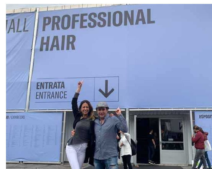
Tian Stil Home a la Fira Internacional de Bolonia, per ampliar coneixements i estar a l'última moda.