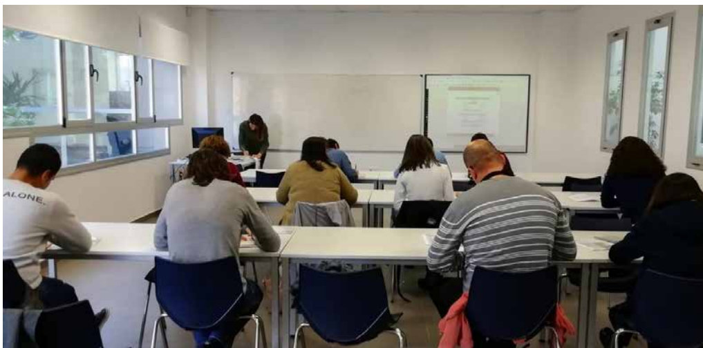
Finalitza l'activitat formativa "Francés sector turístic" de 30h que es va realitzar del 8 al 15 de març, dins del REINICIA'T de l'Agència de Desenvolupament Local