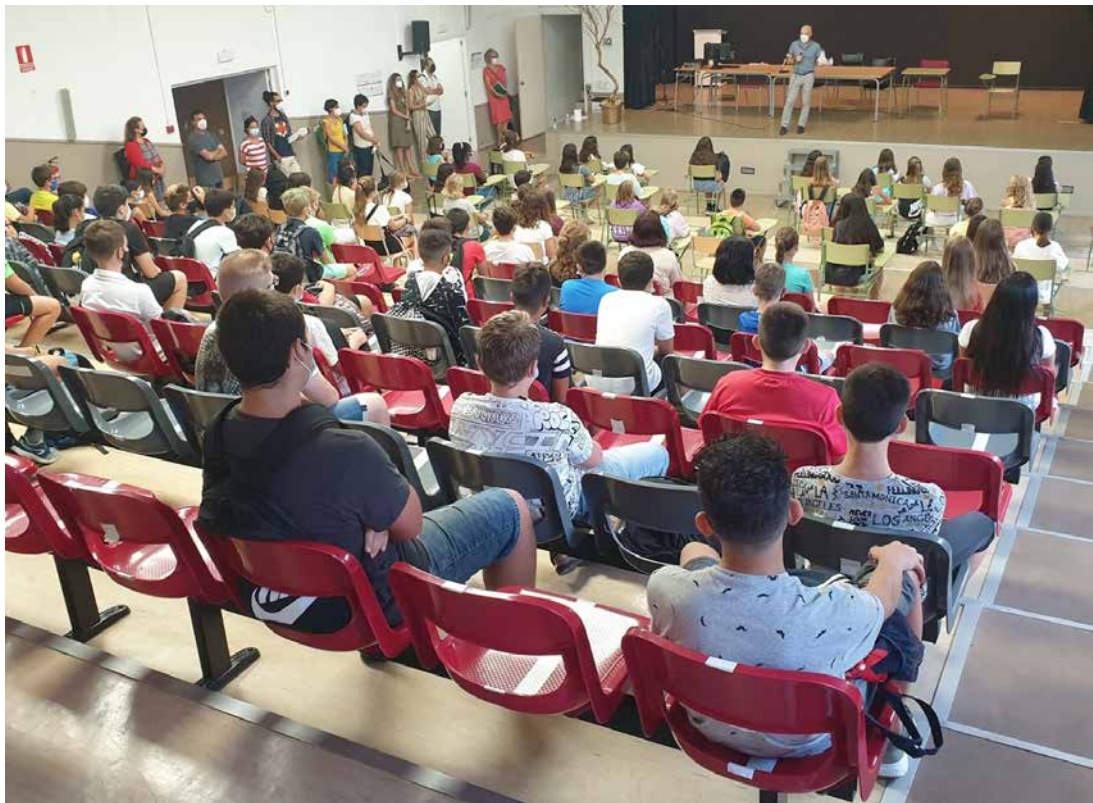
Inici de curs de l'alumnat de 1r ESO de l'IES Leopoldo Querol