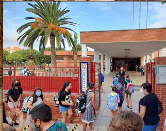
Inici del curs escolar a Vinaròs