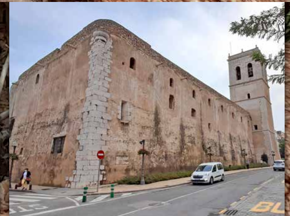
Diputació aportarà 20.000€ a restaurar les pintures de l'Arxiprestal