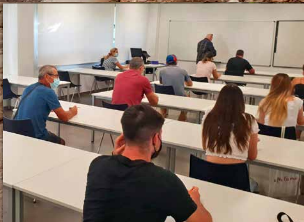
Vinaròs recupera els exàmens teòrics de conducció al Vinalab

La Generalitat eleva al Consell de Ministres la declaració de Zona Catastròfica