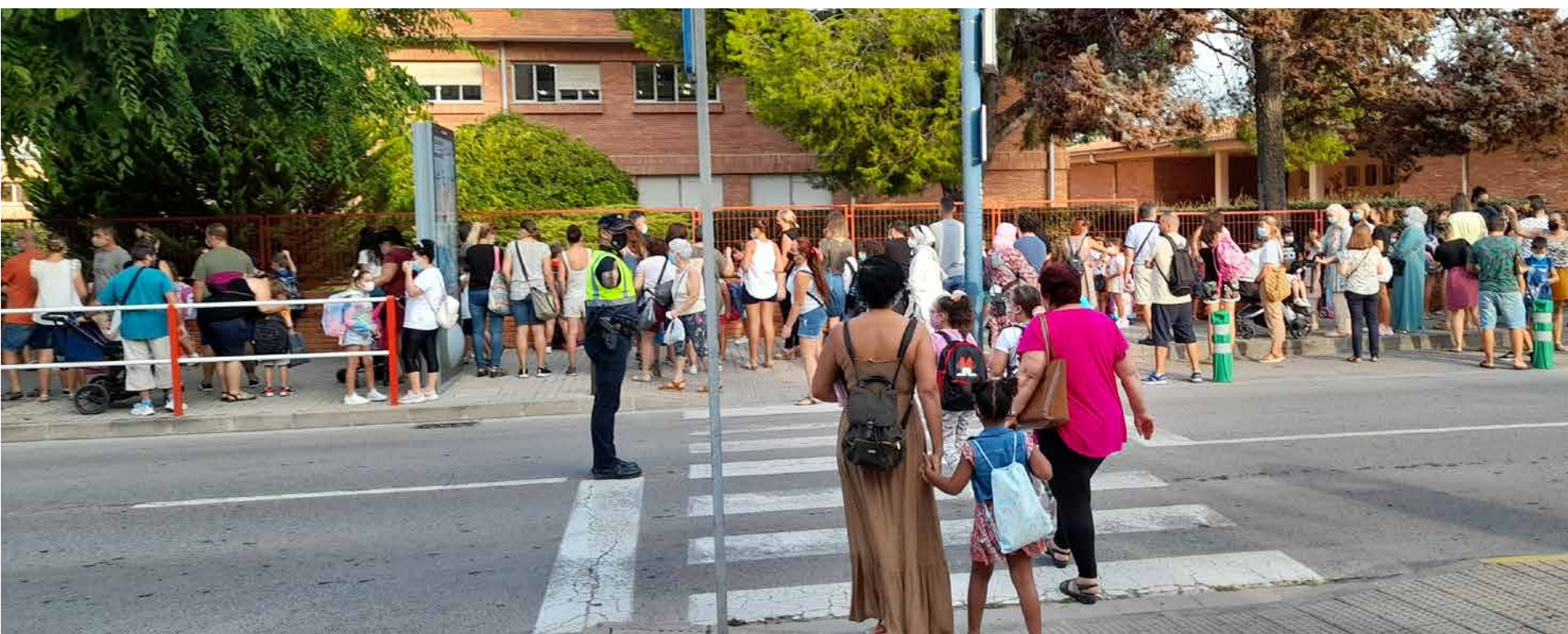
Imatges del primer dia del curs 2021/2022 als col·legis de l'Assumpció i la Misericòrdia, el passat dimecres